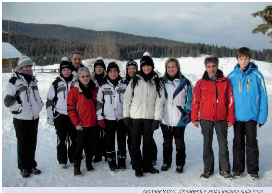
Amministratori, dipendenti e amici insieme sulla neve

Il giorno seguente, sabato, amministratori e dipendenti si sono nuovamente ritrovati per una giornata sulla neve a Barricata, località del comune di Grigno.