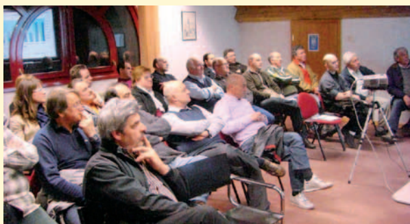
I soci partecipanti alla pre assemblea di Arsìè

Nel corso della successiva discussione sono state date ai soci le spiegazioni richieste. Il presidente ha messo quindi ai voti l'approvazione del bilancio e delle relazioni collegate e la proposta di devoluzione dell'utile, che è stato così destinato: al-