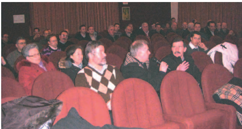
Incontro delle associazioni trentine presso il teatro di Ospedaletto

giormente informale tra i responsabili della Cassa Rurale e chi beneficia del suo sostegno per concretizzare iniziative e manifestazioni. Complessivamente hanno partecipato agli incontri i rappresentanti di cento associazioni che operano sul nostro territorio.