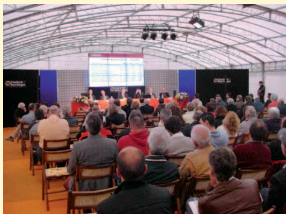
Folta partecipazione di soci all'assemblea generale