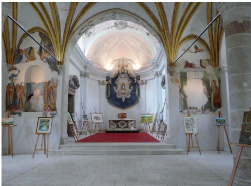
Antica Pieve di Grigno - Mostra “I sensi della Terra”, 24 aprile 2010