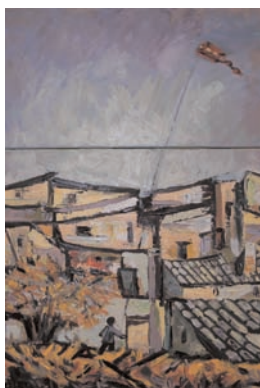
calendario 2012 | sensi della terra

Per il calendario del 2013 si sta intanto pensando ad un concorso fotografico per la raccolta delle immagini, da lanciare il prossimo anno.