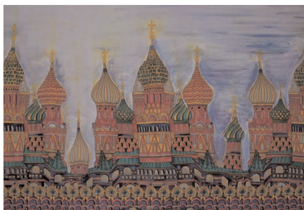
Immagini tratte dal calendario 2012 “I sensi della terra”.