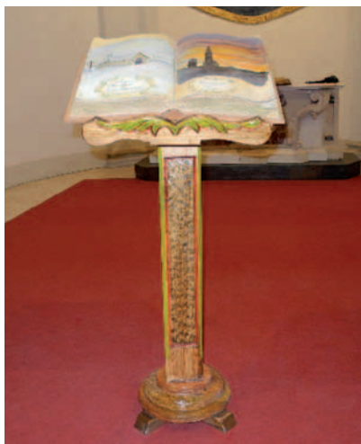
Il premio speciale del concorso