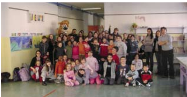
I bambini delle scuole elementari e medie di Cison del Grappa insieme ai loro insegnanti

Scuola media di Fonzaso Scuola media di Grigno Scuola media di Valstagna