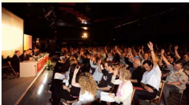
I soci votano per l’approvazione del bilancio